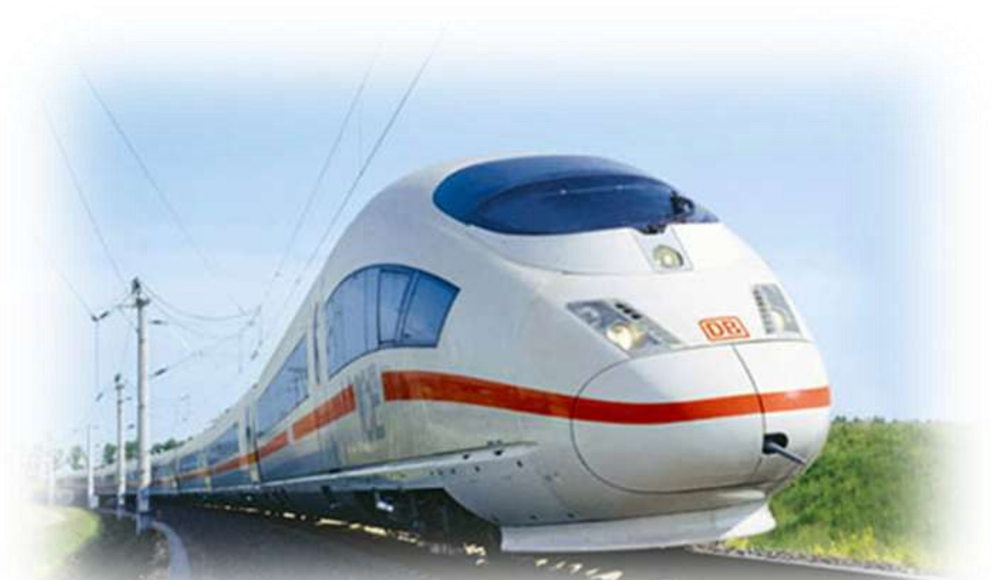
Train - రైలు