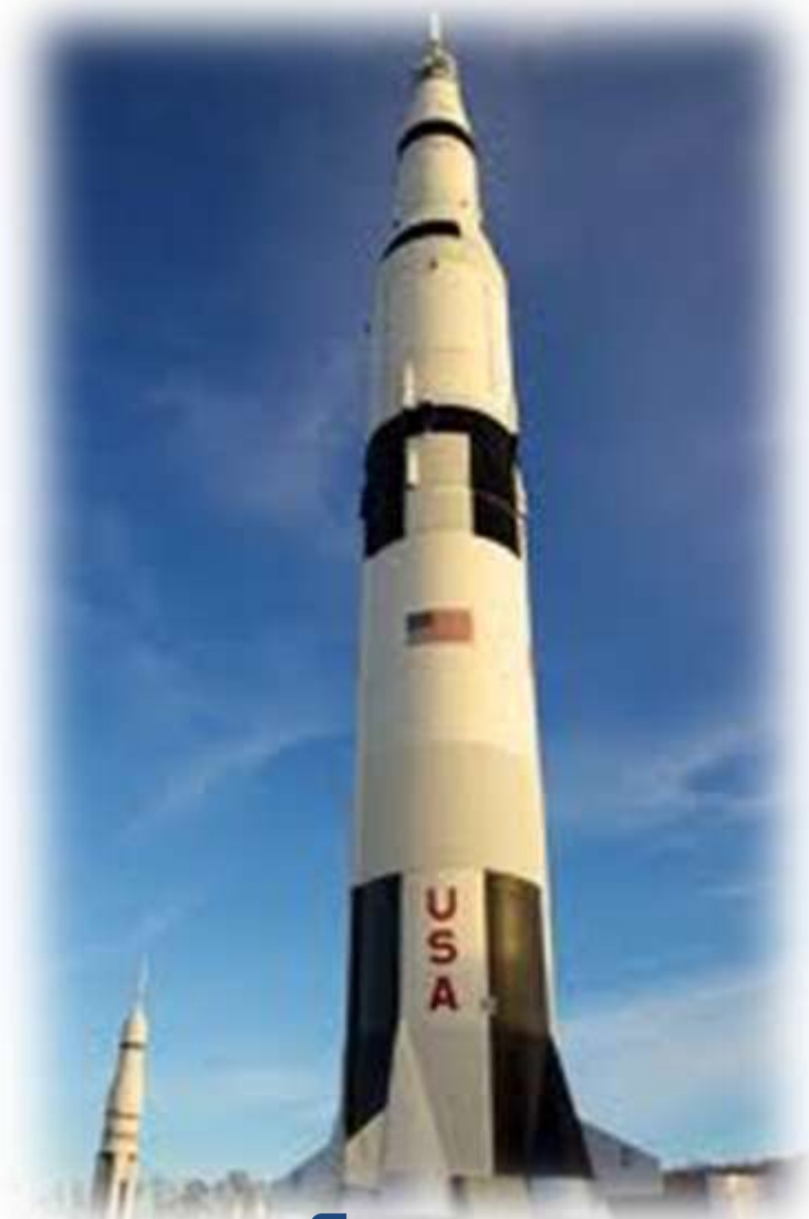
Rocket - రాకెట్