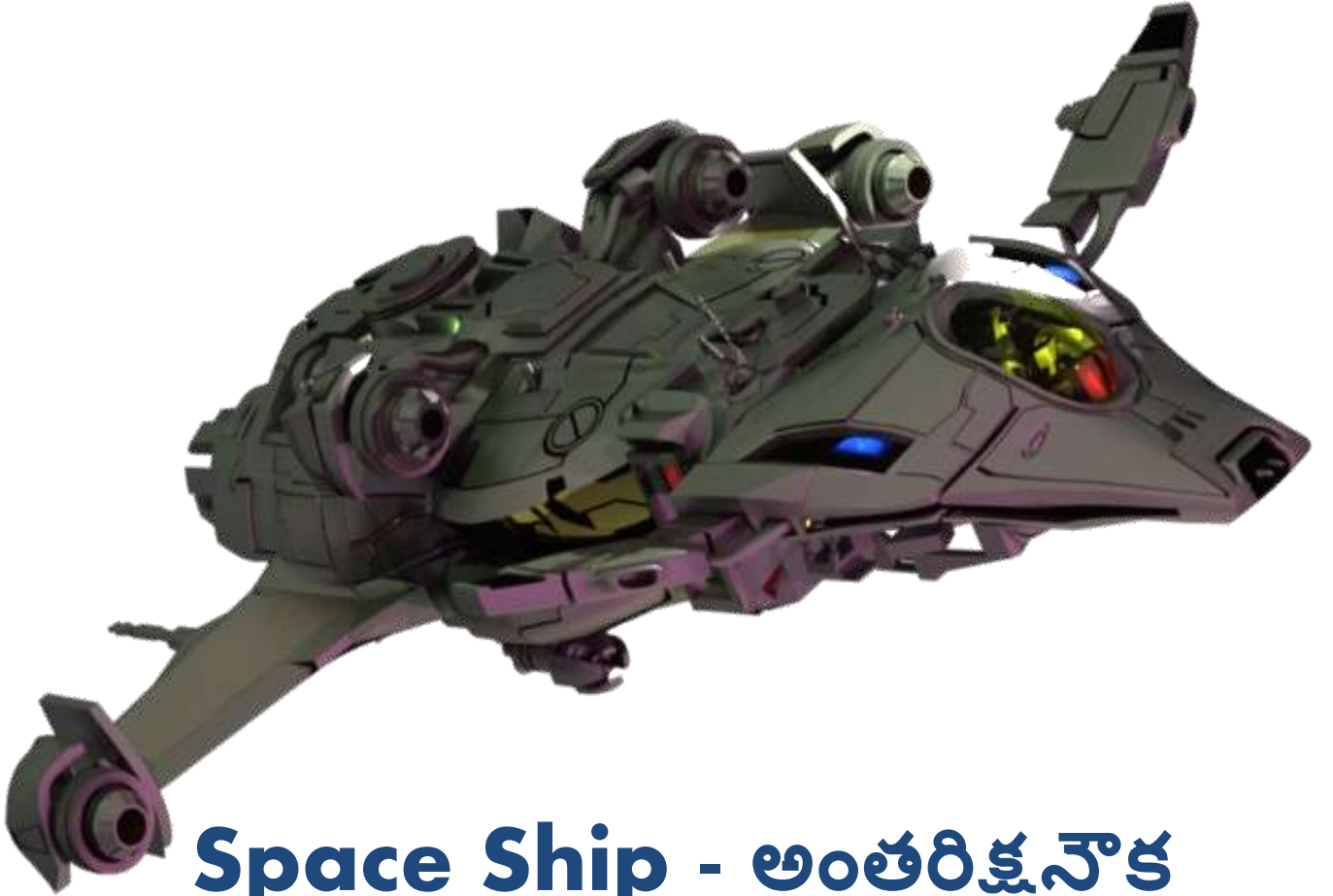
Space Ship - అంతరిక్షనౌక