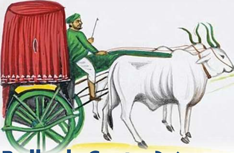
Bullock Cart - ఎడ్డులబండి