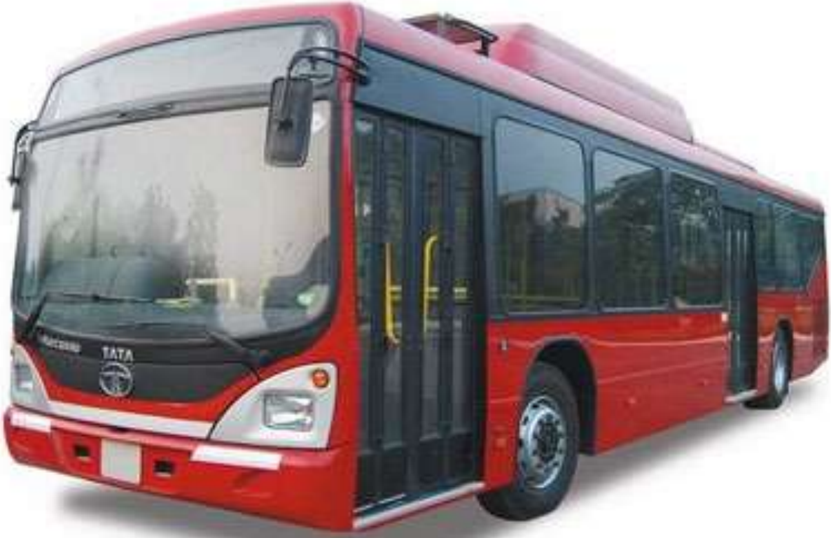
Bus - బస్సు