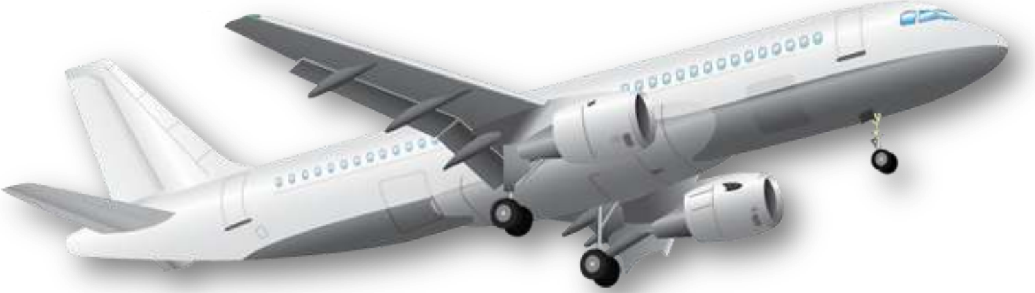
Aeroplane - విమానం