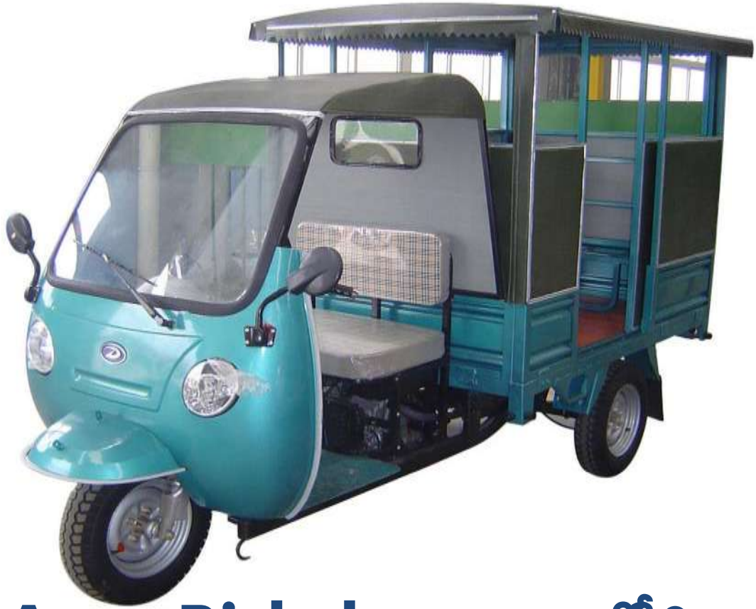
Auto Rickshaw - ఆటో రిక్షా