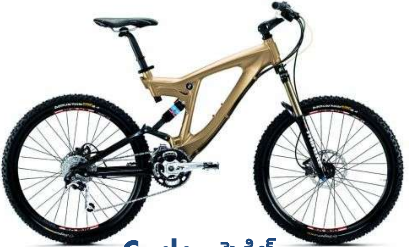
Cycle - సైకిల్