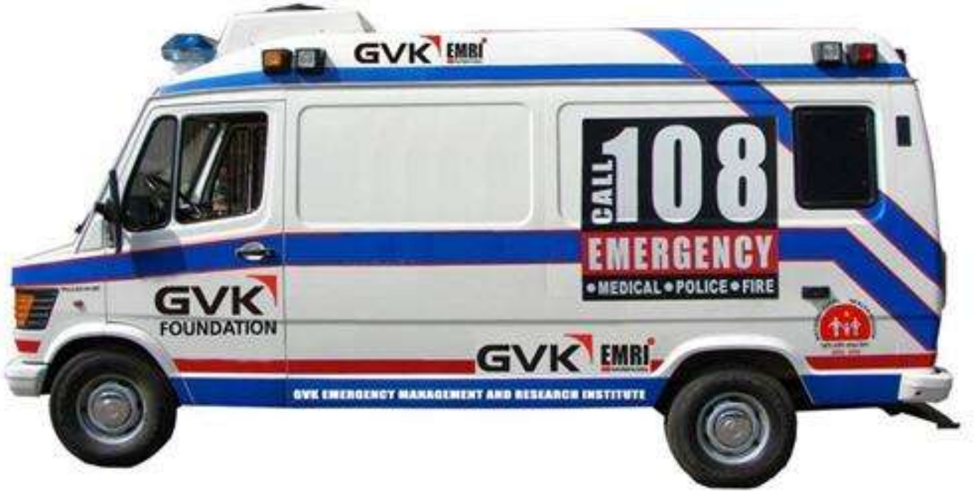
Ambulance – అంబులెన్సు