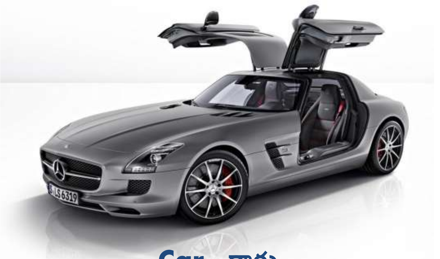
Car - కారు