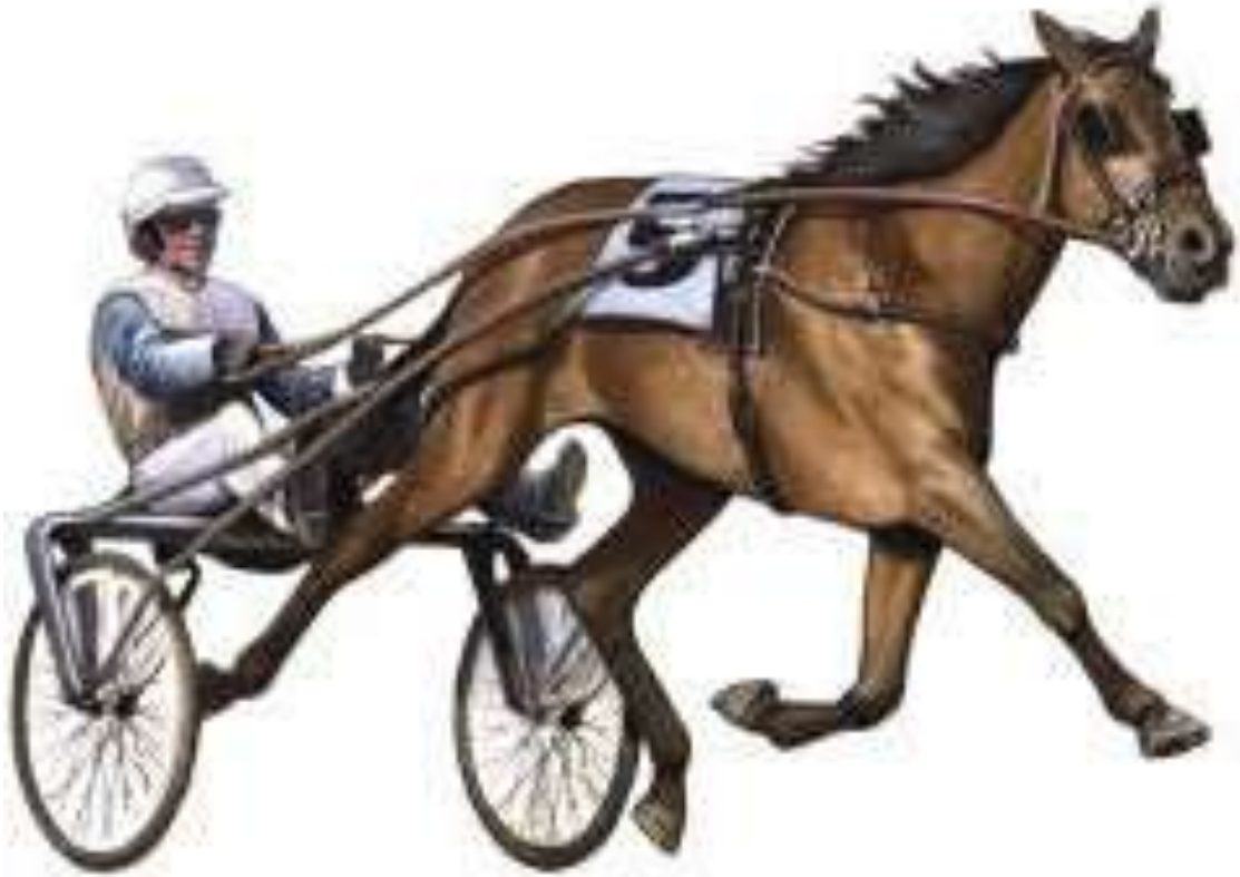
Horse Cart - గుర్రంబండి