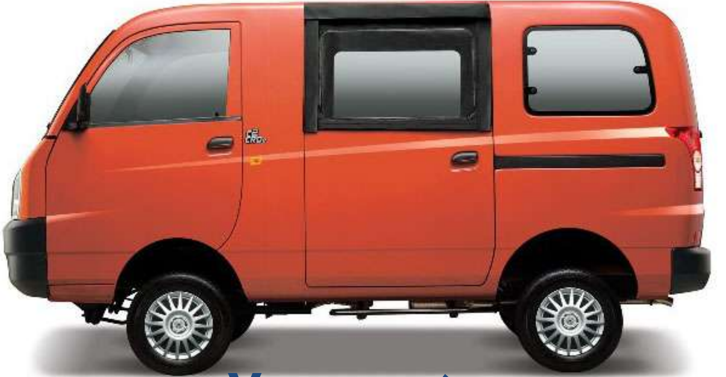
Van - వ్యాను