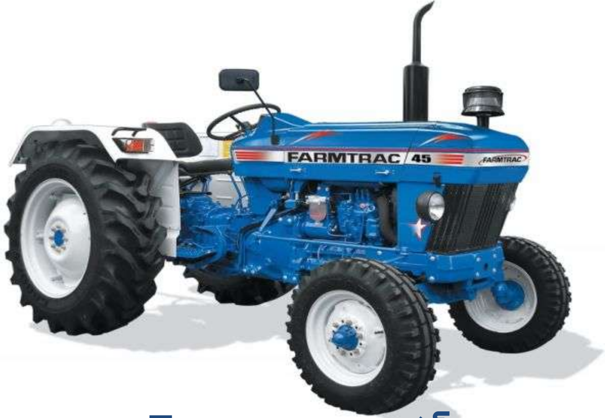
Tractor - ట్రాక్టర్