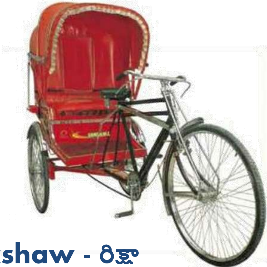
Rickshaw - రిక్షా