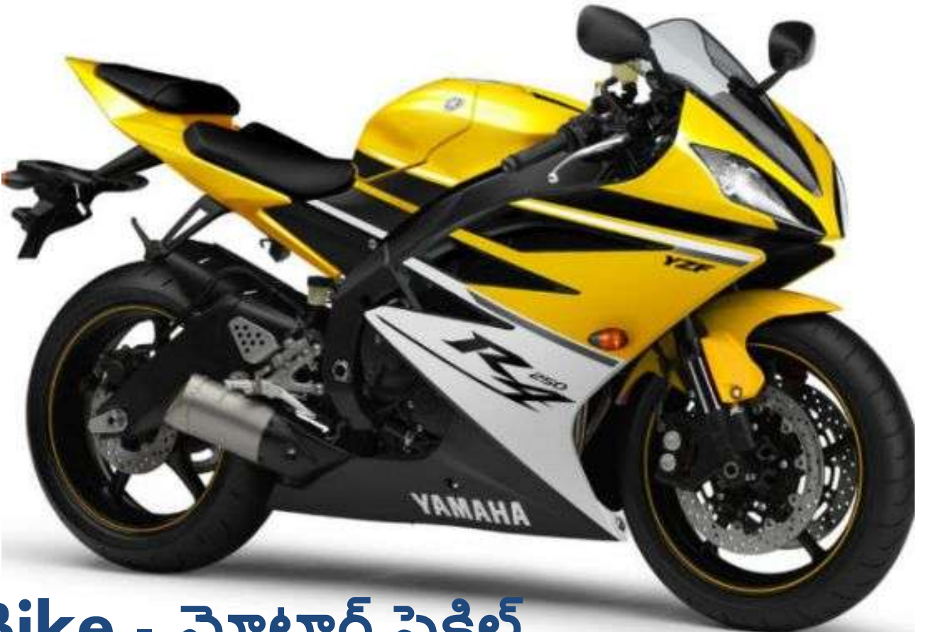
Bike - ಮೊಟಾರ್ ಸೈಕಿಲ್