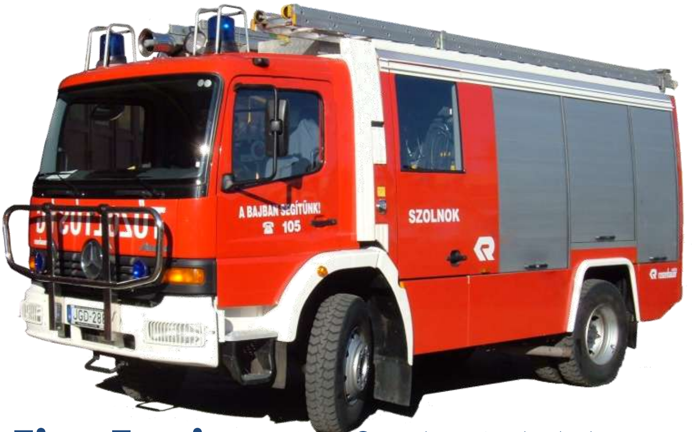
Fire Engine – అగ్నిమాపక శకటం