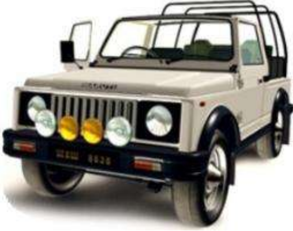
Jeep - జీపు