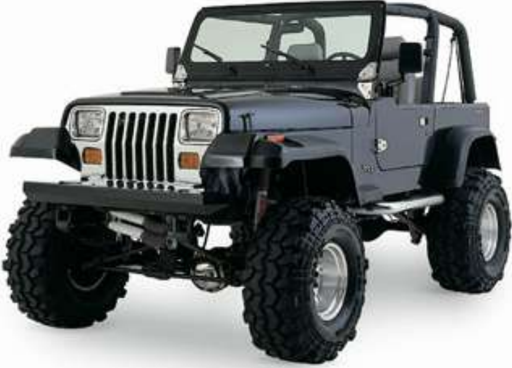
Jeep - జీపు