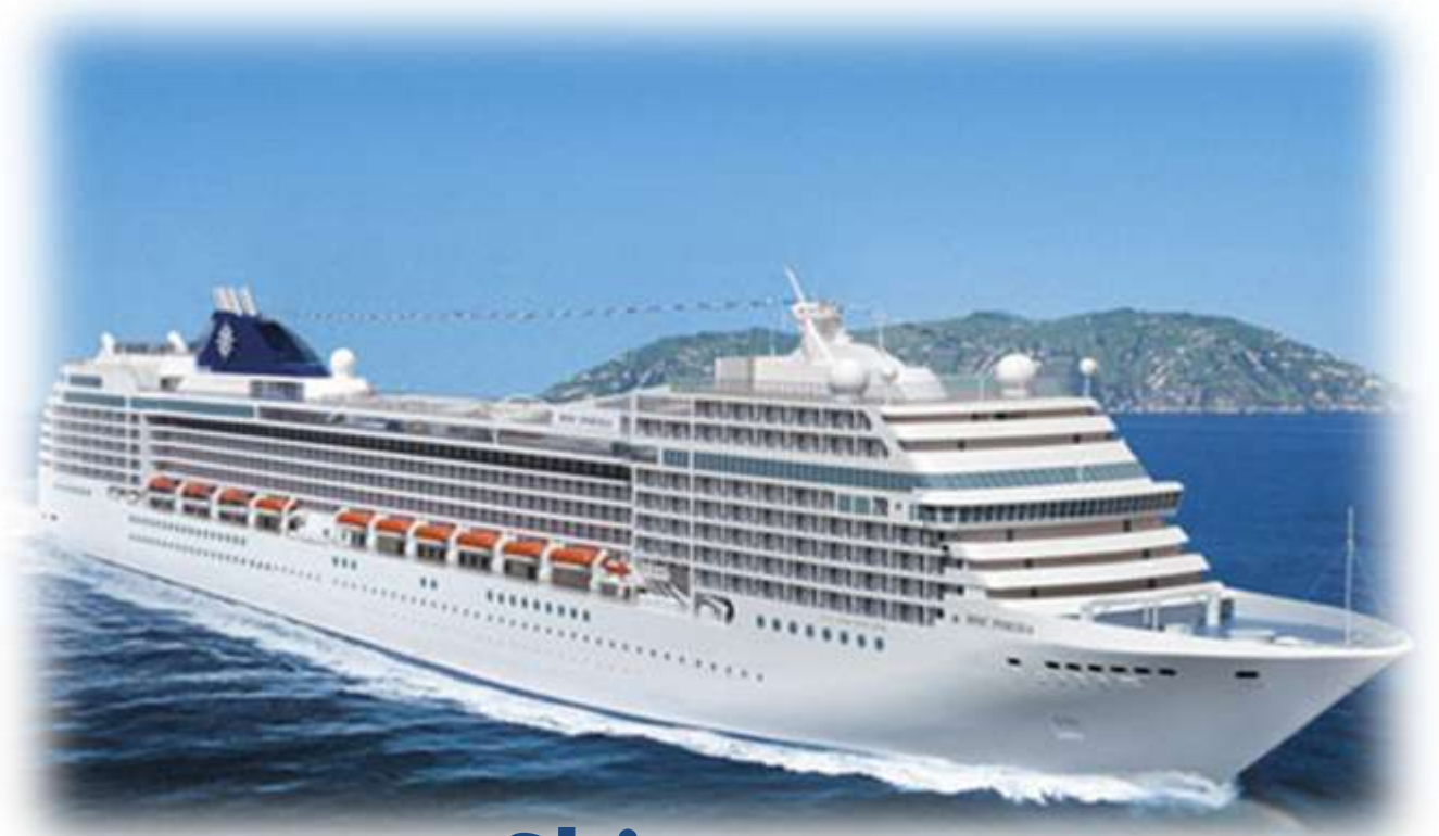
Ship - ఓడ