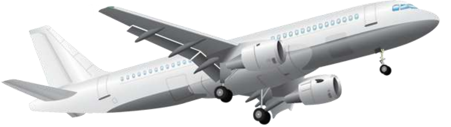
Aeroplane - విమానం