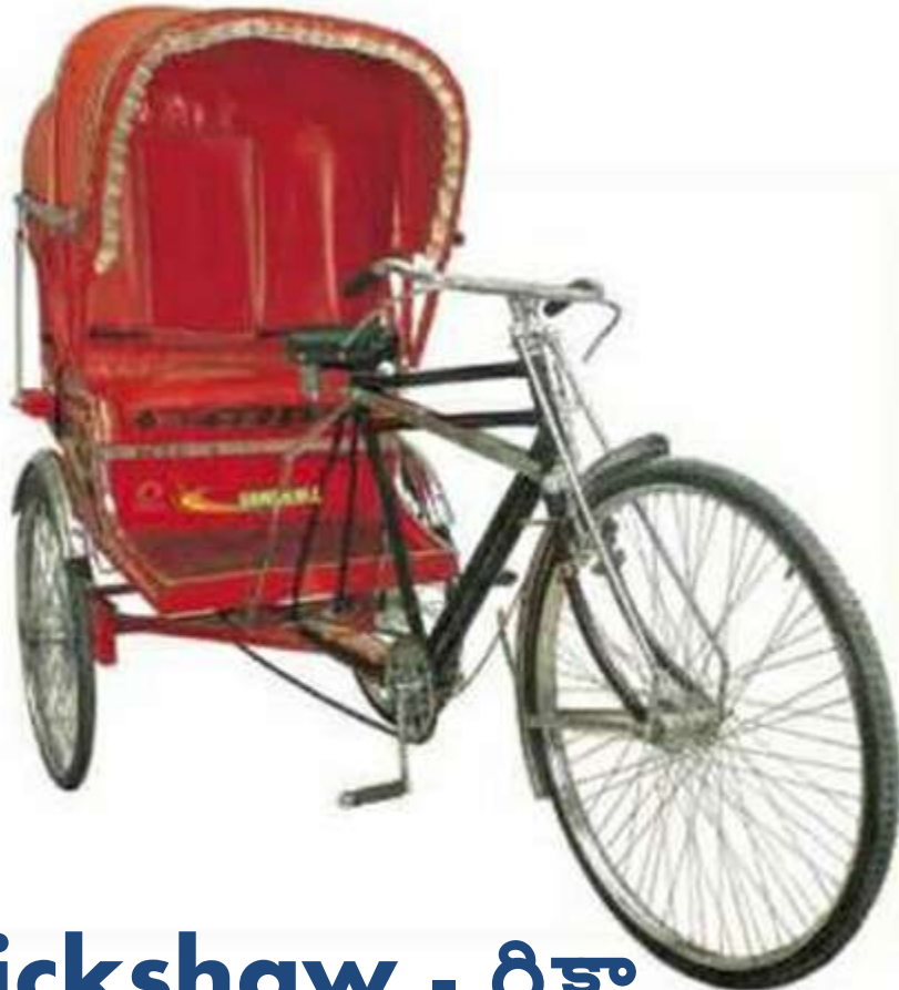
Rickshaw - రిక్షా