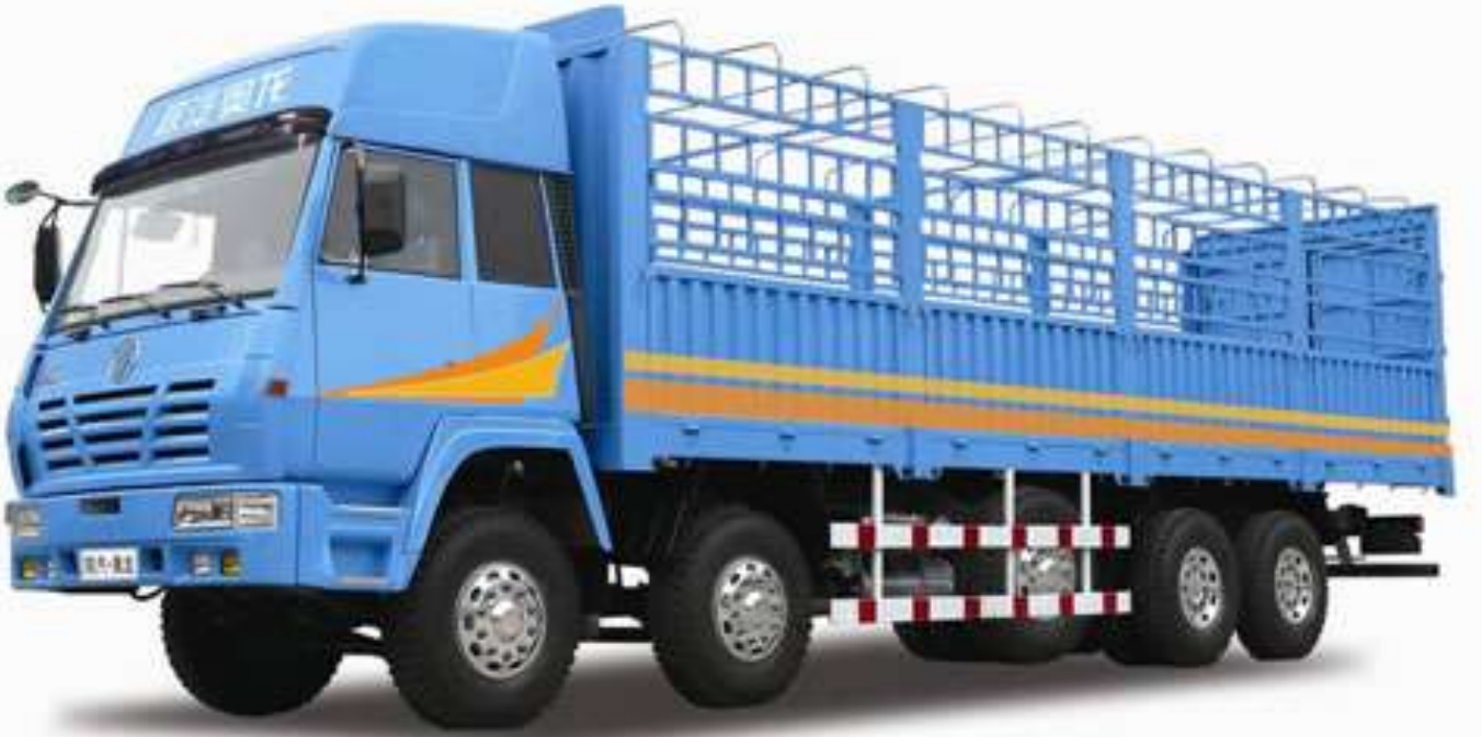
Lorry - లారి