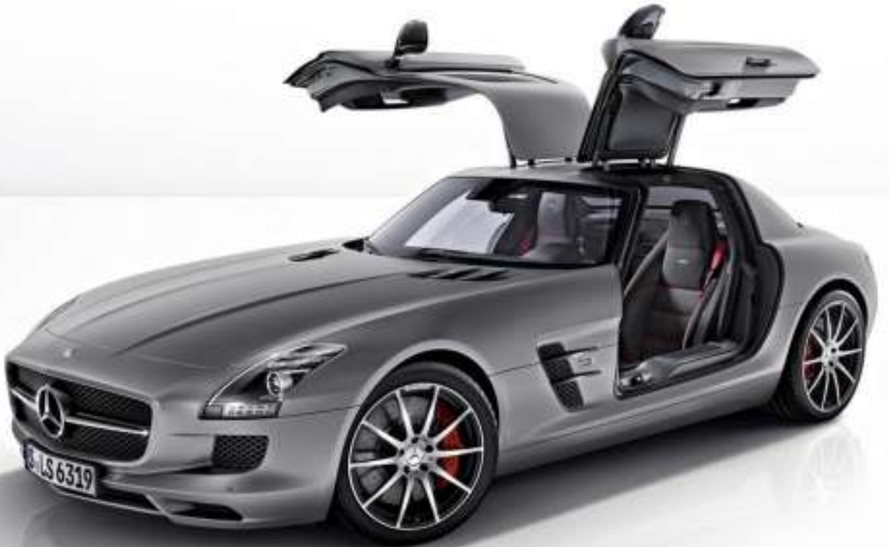
Car - కారు