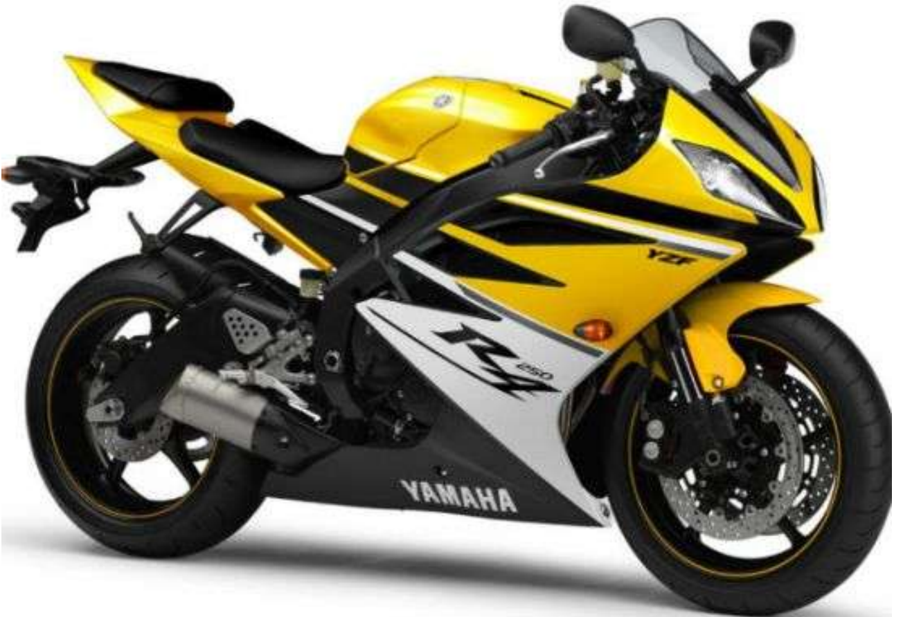
Bike - మోటార్ సైకిల్