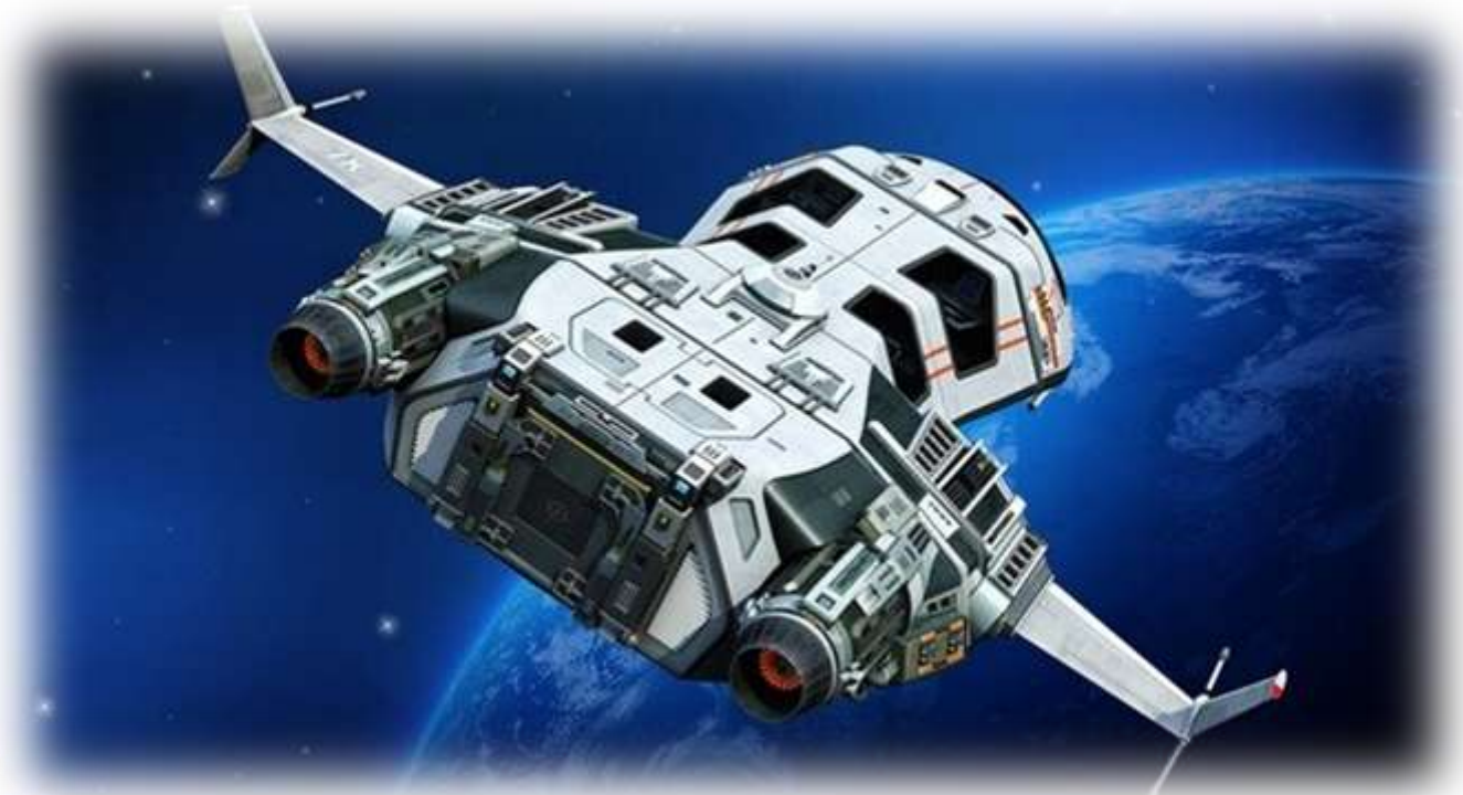
Space Ship - అంతరిక్షనౌక